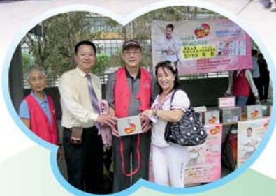
▲理幹事工作人員深圳參觀交流