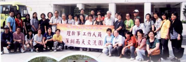
理幹事工作人員 深圳兩天交流團

今年是祖國成立60周年的大日子，為了加深認識對國家60年來所取得的輝煌成績，香港回歸後的變化，以及工會近年的會務發展等，在10月份安排了理幹事和義工到深圳參觀，對「國事、港事、會事」進行交流和研討，分享對「三情」的體會和心得，藉此增強我們彼此間的凝聚和歸屬感。