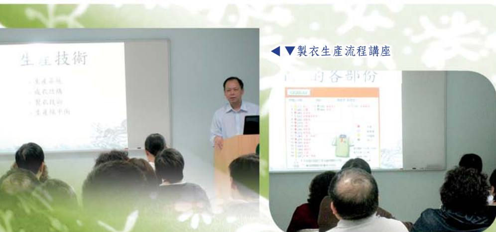
◀◀ 製衣生產流程講座