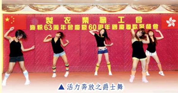
▲ 活力奔放之爵士舞

日期：3月1日至5月24日 (逢星期一) 時間：晚上7:15-8:45分 (10節) 費用：180元，組 / 社員195元