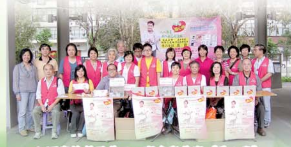
▲ 頤康社員及義工，齊參與義賣“愛心券”

日期：1月8日至4月9日 (逢星期五) 時間：下午3:00-4:30 (共10節) 費用：40元 (只限社員參加)