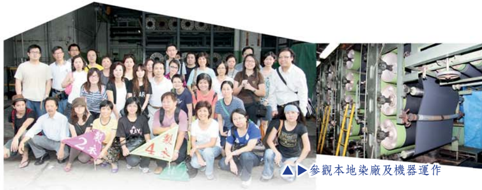
▶▶ 參觀本地染廠及機器運作